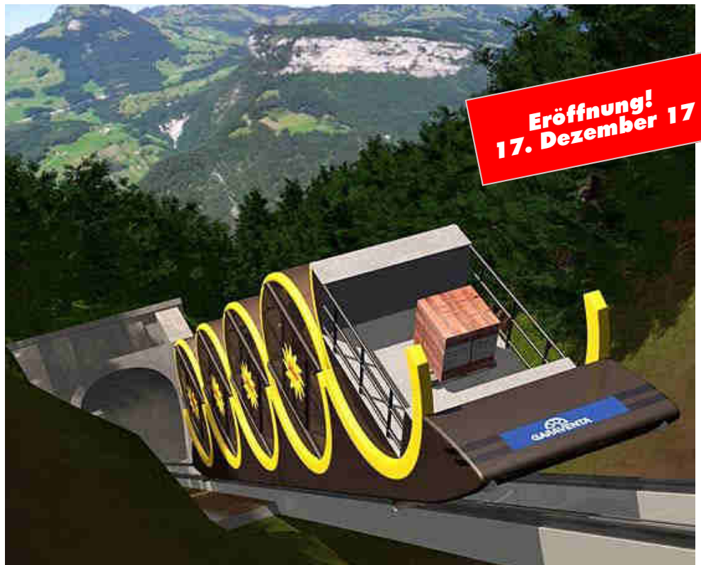
Diese futuristische Bahn wurde konzipiert durch Garaventa, kann max. 136 Personen befördern, Höhendifferenz 744 m, Fahrdauer ca. 3.5 Min.