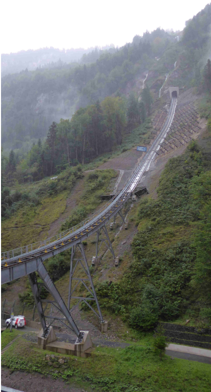
110% Neigung - Talstation Extremste Bedingungen...