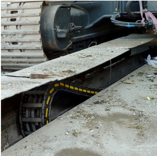
Führungskanal mit massiver klappbarer Abdeckung