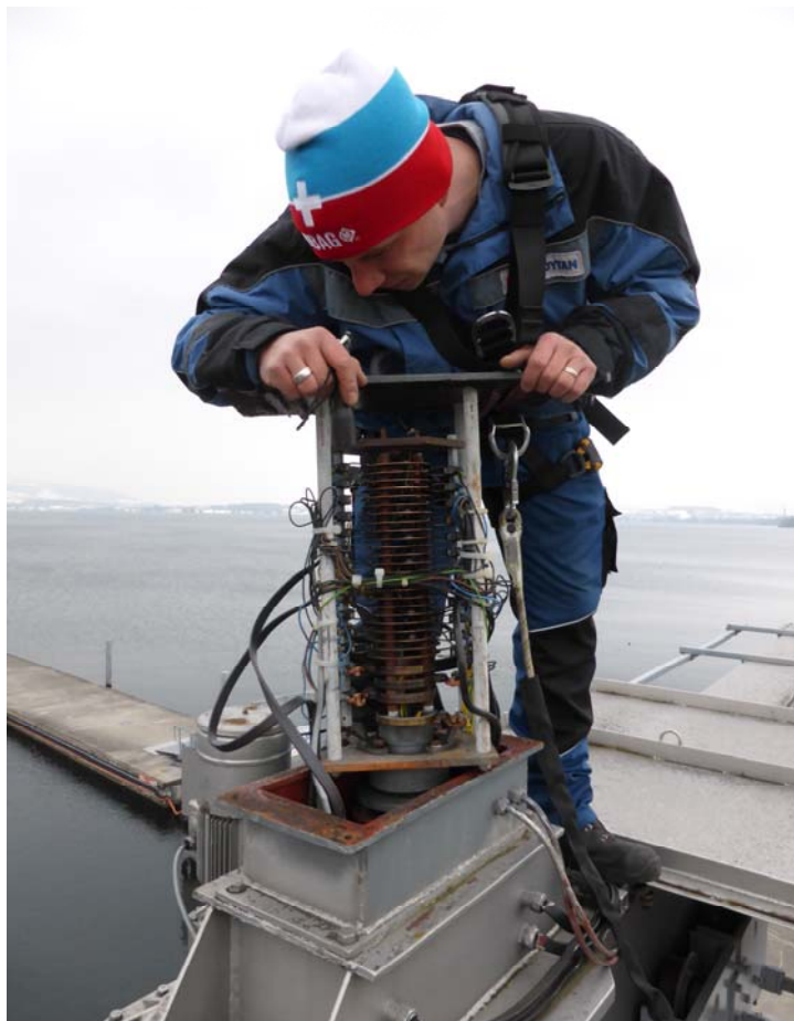
Demontage und Montage des Schleifringkörpers in luftiger Höhe!