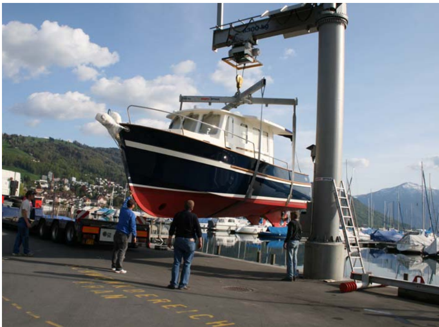
Termingerecht zur Saison 2015 können die Schiffe wieder in den Zugersee sicher eingewässert werden