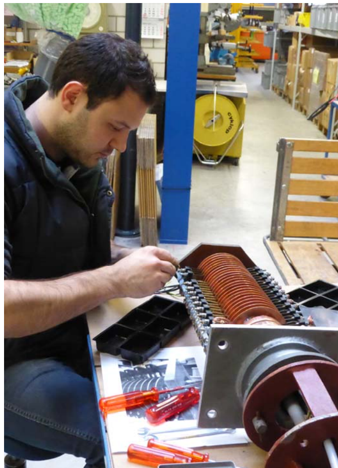
Revision des 29-poligen Schleifringkörpers im Hause MIBAG, inklusive Verdrahtung und neuer Lackierung