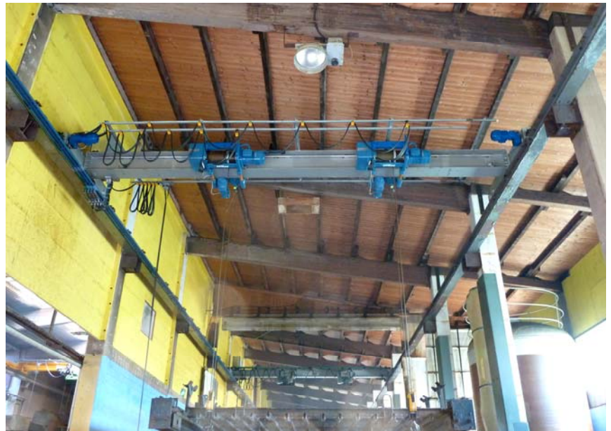
Einsatz in Verzinkerei Wollerau unter extremen Bedingungen