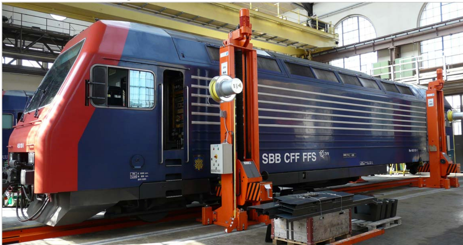
SBB-Hauptwerkstätte - verschiebbare Hubsäulen mit H+K Federleitungstrommel für die ergonomische und sichere Ausführung von Wartungsarbeiten an den SBB-Loks