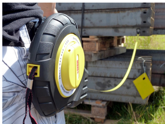
Gurtclip, einfach am Gurt einschlaufen