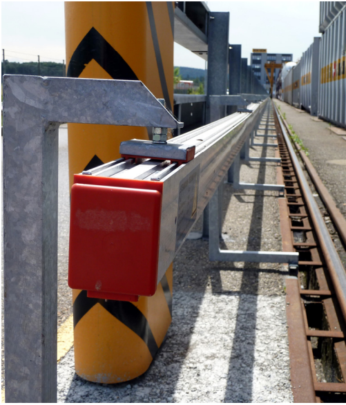
Ständerkonstruktion in massiver Stahlausführung mit Gleitauhängungen