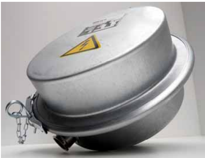
Schleifringkörper drehbar gelagert IP65 Schutz