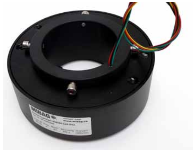
Hohlwelle aus Aluminium, nach Kundenwunsch