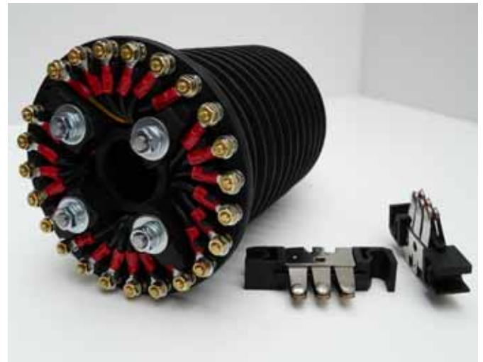
Fertig verdrahtet mit Fingerstromabnehmer