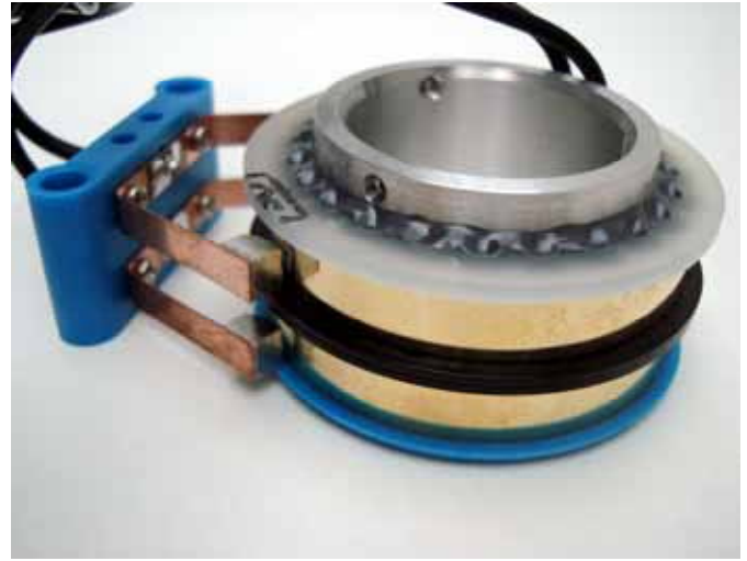
Speziell mit Innen-Bohrung D= 80 mm