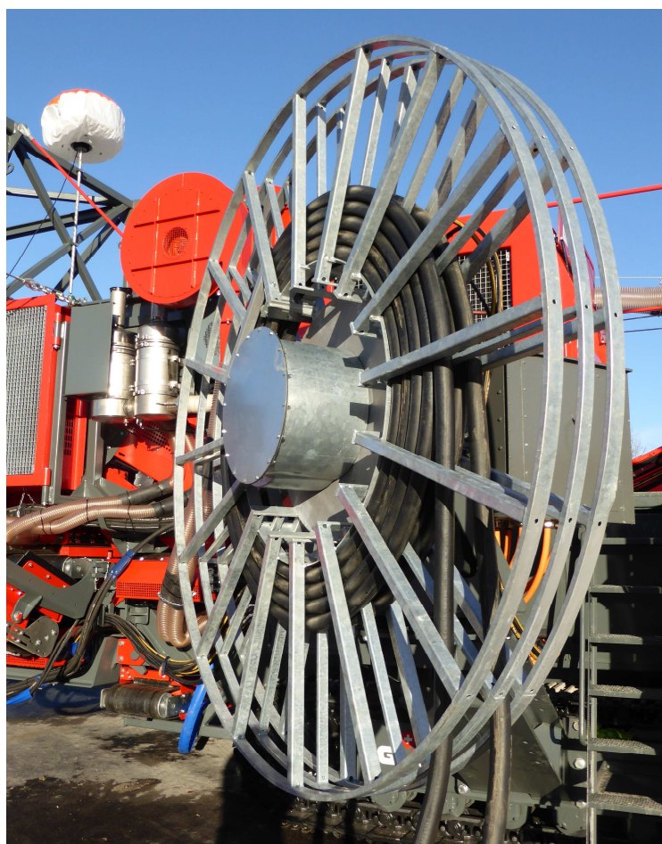
Motorleitungstrommel Typ HYGN5, mit Hydrauliktrommel-Antrieb, Durchmesser 2.8 m!, v = \text{max. } 60 \text{ m/min.} , für die spiralförmige Wicklung von 2 Leitungen à je 4 x 185 mm 2 !