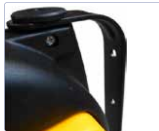
Wandhalterung aus Stahl