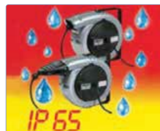
Attention, également livrable en classe IP65, voir ci-dessous art. N° 0031582765