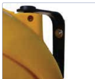
Patte de fixation murale orientable