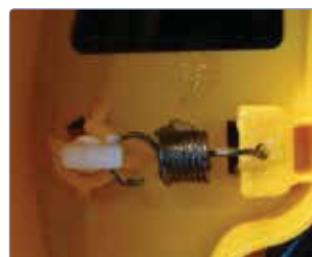
Blocage du câble à la longueur désirée