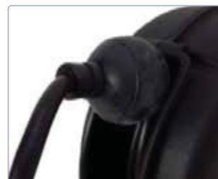
Tampon en caoutchouc