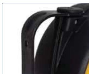
Patte de fixation murale en acier