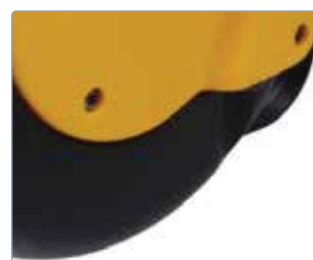
Coques en plastique antichoc