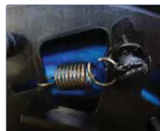
Coques en plastique antichoc