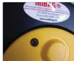
Tampon en caoutchouc