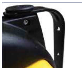
Patte de fixation murale en acier