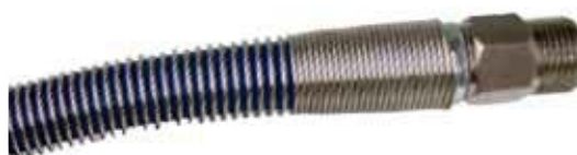
Protection de tuyau avec filetage extérieur pivotant pour une utilisation facile pas de torsion du tuyau