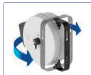
Guidage de rouleaux / fenêtre d'introduction pour tuyau intégré